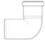
1 x 87° bend