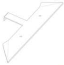
1 x fitting No. 1