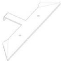
1 x fitting No. 1